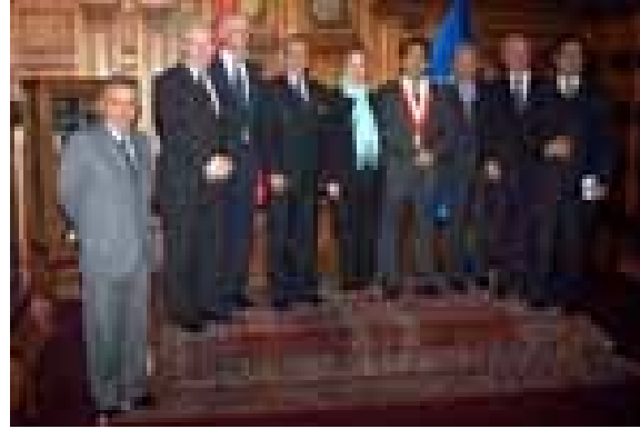
14 DE JULIO DE 2005 SEÑORA BETINA FERRERO, COMISARIA (CANCILLER) DE RELACIONES EXTERIORES DE LA UNIÓN EUROPEA