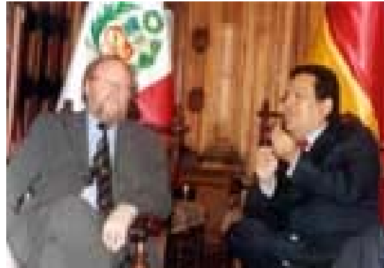
6 DE DICIEMBRE DE 2004 PRESIDENTE DEL PARLAMENTO ALEMÁN, EXCELENTÍSIMO SEÑOR WOLFGANG THIERSE.